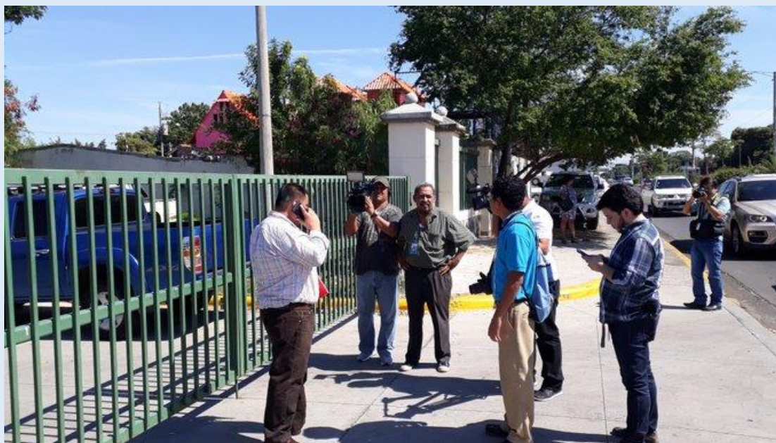
(Anexo 1) Periodistas de Jinotepe y Managua se les niega el acceso a ingresar a eventos públicos.