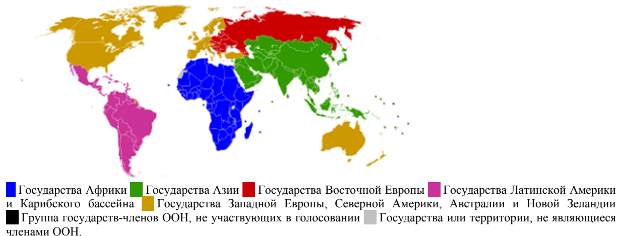
Таблица 2: Состав региональных групп в СПЧ

Источник: http://en.wikipedia.org/wiki/United_Nations_Regional_Groups